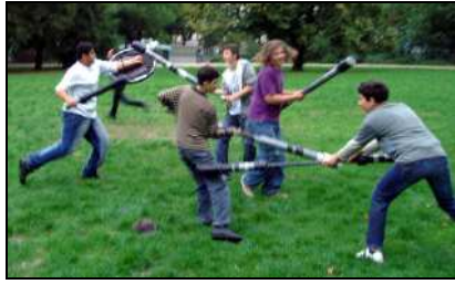
Eines der ersten Trainings in der Hasenbeide.

Während die Pompfen fertiggestellt und die entliehenen Spielgeräte dem Jugger e.V. zurückgegeben wurden, wurde eine Trainingsmöglichkeit für den Winter gesucht. Dies erwies sich als außerordentlich schwer, da offenbar ein Mangel an Hallen herrscht: Glücklicherweise wurde von der Boddin-Grundschule die Gymnastikhalle zur Verfügung gestellt. Sie ermöglicht zwar kein Spieltraining, wohl aber Techniktraining. Für den Fall, daß der Projektleiter beruflich abwesend sein musste, hatte er den Trainer der Jugger-Mannschaft des TSV Rudow (ein ehemaliges Mitglied seines eigenen Teams) als Vertretung gewinnen können, was aber nur ein Mal notwendig gewesen ist. Derzeit steht dem Projektleiter ein anderer erfahrener Spieler des TSV Rudow (Team Skúll) zur Seite.