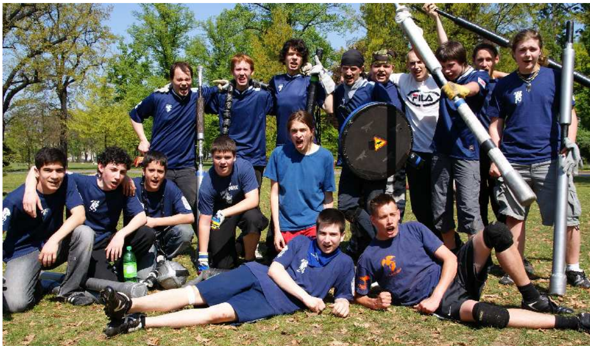
Falcones44 und das Team des Trainers, die Lagerfalken, auf dem Berliner Juggerpokal 2009.

Noch interessanter für die Argumentation wird das eingangs erwähnte Buch im Verlag der Jugendkulturen sein (Wickenhäuser. Jugger. Der Endzeit-Sport, Berlin 2010)