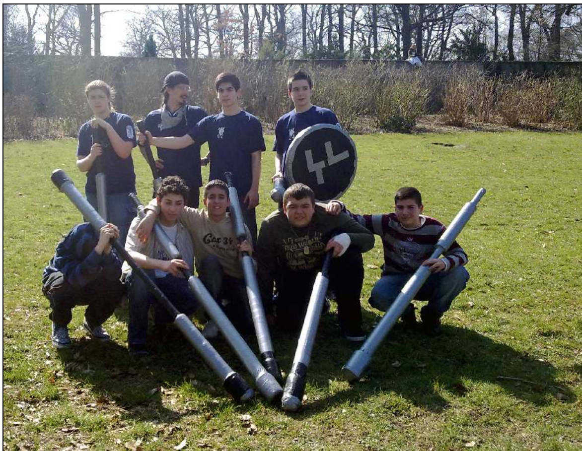
Layout, Titelgestaltung, Trikot- und Logodesign: Wickenhäuser

Dr. Ruben Philipp Wickenhäuser, Projektleiter