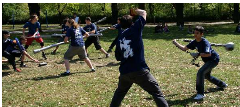
Berliner Juggerpokal 2009: Voller Einsatz!

Du mußt fair spielen, sonst geht es nicht! (durchaus nicht zahmer) Spieler zu einem Neuling