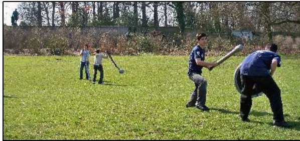
Unter den Augen von Turnvater Jahn: Falcones44 beim Training in der Hasenheide.

Vom Projektleiter wurde ein Freundschafts- und Trainingsspiel gegen die beiden Teams des TSV Rudow am ersten Donnerstag zu Ostern angesetzt, wo die Schüler erste Erfahrung sammeln im Spiel gegen ein anderes Team sammeln konnten. Mit Beginn der warmen Jahreszeit ist es auch endlich wieder möglich, im Freien zu trainieren. Turnvater Jahn, dessen Statue über den Trainingsplatz in der Hasenheide blickt, hätte seine Freude daran.