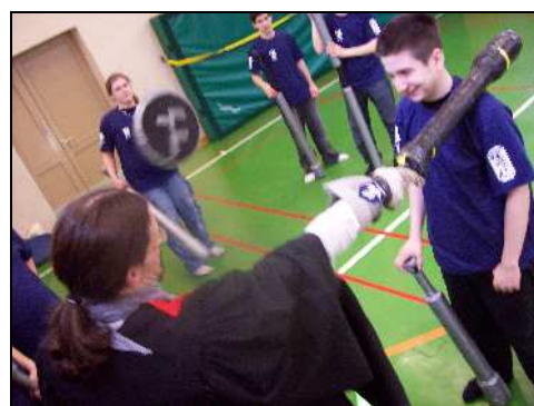
... und "Ritterschlag" zum Mitspieler der Falcones44