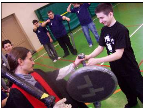
Übergabe der Pompfen

Die Teamlogos wurden in Absprache mit dem Schülern vom Projektleiter designt. Im Rahmen der feierlichen Übergabe wurde jeder Schüler nun zum Mitspieler des Teams "geschlagen", wobei ihm das Versprechen abgenommen wurde, sich stets für sein Team einzusetzen, fair zu spielen und sich niemals im Zorn gegen andere Spieler zu wenden.